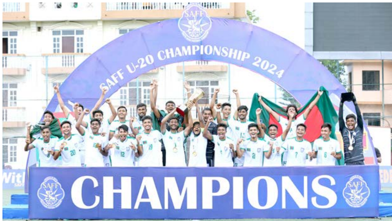
साफ यू-२० च्याम्पियनसिप उपाधि जितेपछि बंगलादेशी टोली।

बंगलादेशले यू-१८, यू-१९ र यू-२० उमेर समूहमा हुने प्रतियोगिताको पहिलोपटक उपाधि जितेको हो। यसअघि बंगलादेश दुईपटक फाइनलमा पुग्दा पनि चुकेको थियो। जितपछि बंगलादेशका प्रशिक्षक मरफुल हकले उपाधि विद्यार्थी आन्दोलनमा ज्यान गुमाएकालाई समर्पित गरेका छन्। 'यो उपाधि विद्यार्थी आन्दोलनमा ज्यान गुमाएकालाई समर्पित गर्दा, उपाधि उचालेपछि उनले भने, 'नेपाली खेलाडीले दबावमा खेलेपछि लगातार गल्ती गरिरहे।'