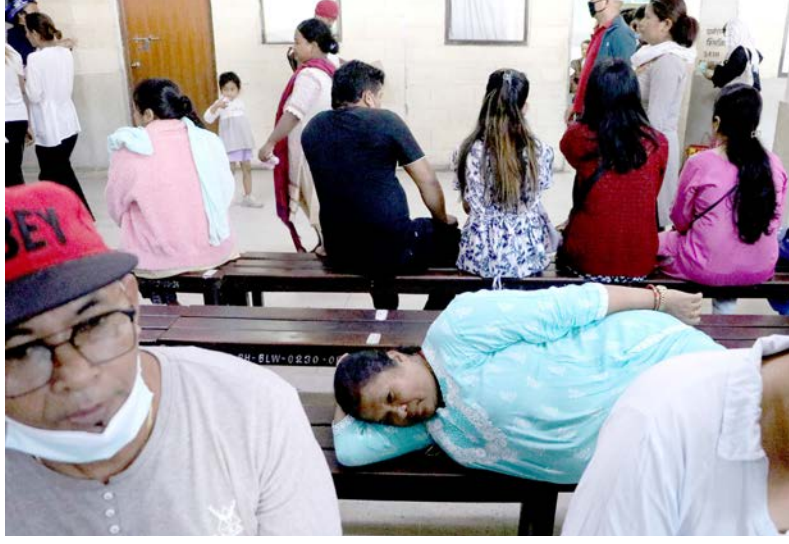
थाइराइड र कोलेस्ट्रॉलको उपचारका लागि पाटन अस्पताल पुगेकी ६६ वर्षीया महिला बेन्चमै आराम गर्दै।