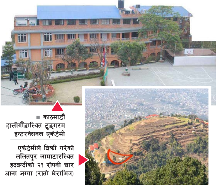
काठमाडौं हात्तीगाँडास्थित टुङ्गराम इन्टरनेसनल एकेडेमी एकेडेमीले बिक्री गरेको ललितपुर लामाटारस्थित हदबन्दीको २१ रोपनी चार आना जग्गा (रातो घेराभित्र)