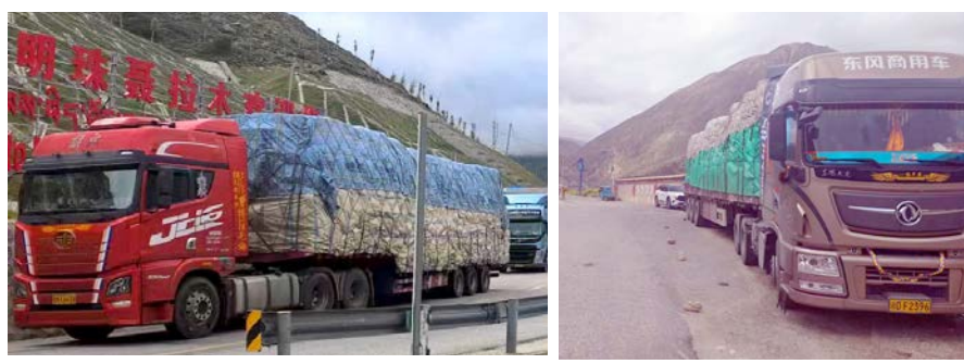
नेपालका लागि लत्ताकपडा र फलफूल बोकेका चिनियाँ कन्टेनर खासा सडकमा अलपत्र अवस्थामा

चाँडो कन्टेनर ह्युटाउन नसके काठमाडौँसहित प्रमुख सहरमा दसैँका लागि नयाँ कपडा पाउन मुस्किल हुने व्यवसायीको दाबी