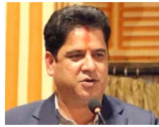
● दामोदर भण्डारी उद्योग, वाणिज्य तथा आपूर्तिमन्त्री

सरकारले उद्योग, वाणिज्य तथा आपूर्ति क्षेत्रमा विद्यमान समस्या तथा चुनौतीलाई सम्बोधन गर्दै सेवा प्रवाहलाई सरलीकरण गर्नेदेखि औद्योगिक सम्बन्ध सुमधुर बनाउने, उत्पादन वृद्धि गर्ने, निर्यात प्रवर्द्धन, व्यापार घाटा न्यूनीकरण, औद्योगिक तथा व्यापारिक पूर्वाधारको निर्माण, उपभोक्ता हित संरक्षण र आपूर्ति व्यवस्था दुरुस्त बनाउनेसम्मका कार्ययोजना अघि बढाएको छ। यसै सन्दर्भमा उद्योग, वाणिज्य तथा आपूर्ति मन्त्रालय र मातहतका निकायबाट प्रवाह हुने सेवालाई समेत समेट्दै समृद्ध नेपाल सुखी नेपालीको लक्ष्य प्राप्तिका महत्वपूर्ण योगदान पुऱ्याउन यो कार्ययोजनाको तयार गरिएको छ। कार्ययोजना सरोकारवालाका सुभामसमेत समेटिएका छन्।