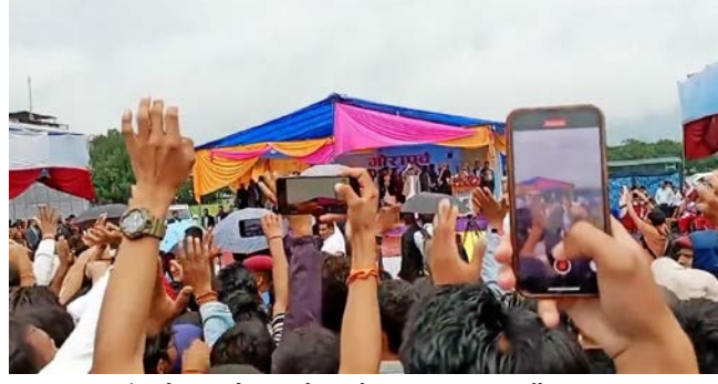
टुँडिखेलमा सोमबारको कार्यक्रममा नाराबाजी गर्दै युवा ।